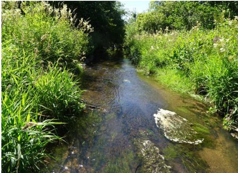
Abb. 10: Unterlauf des Röthenbachs mit flutender Wasservegetation

Im Gebiet wurde der LRT 3260 an mehreren Abschnitten der Haidenaab, am Unterlauf des Röthenbachs sowie an der Creußen in Grafenwöhr und flussabwärts davon erfasst.