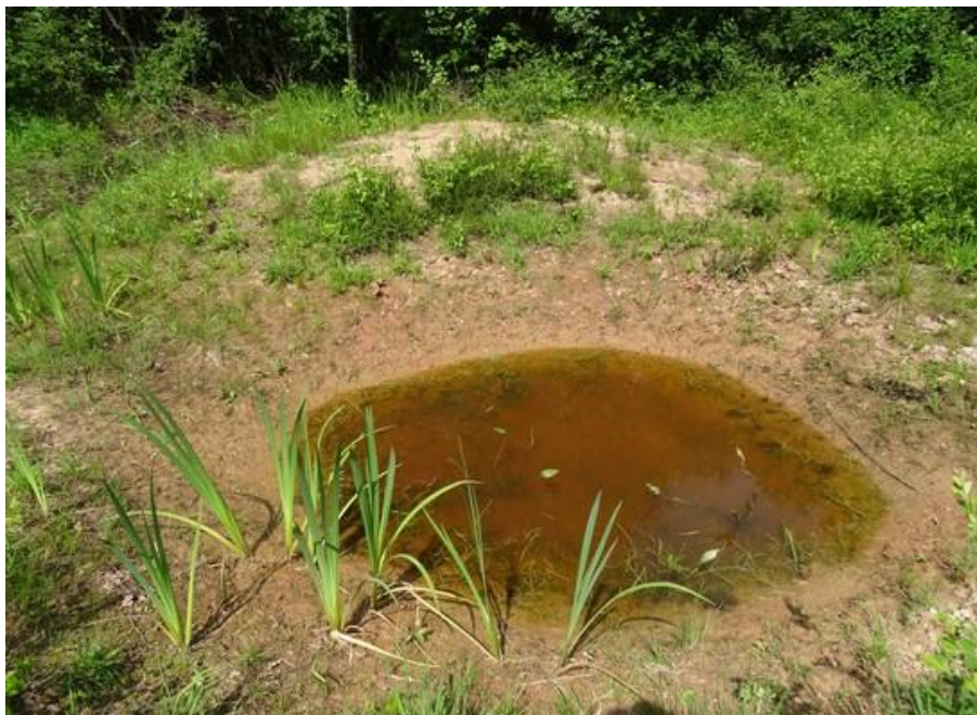
Abb. 9: Oligotropher Tümpel nahe Bärnwinkel mit u.a. Zwiebel-Binse und Später Gelb-Segge am Ufer

fassten Fläche ein und bildet einen Komplex mit initialem Rohrkolben-Röhricht und Rohboden ohne biotopspezifische Vegetation.