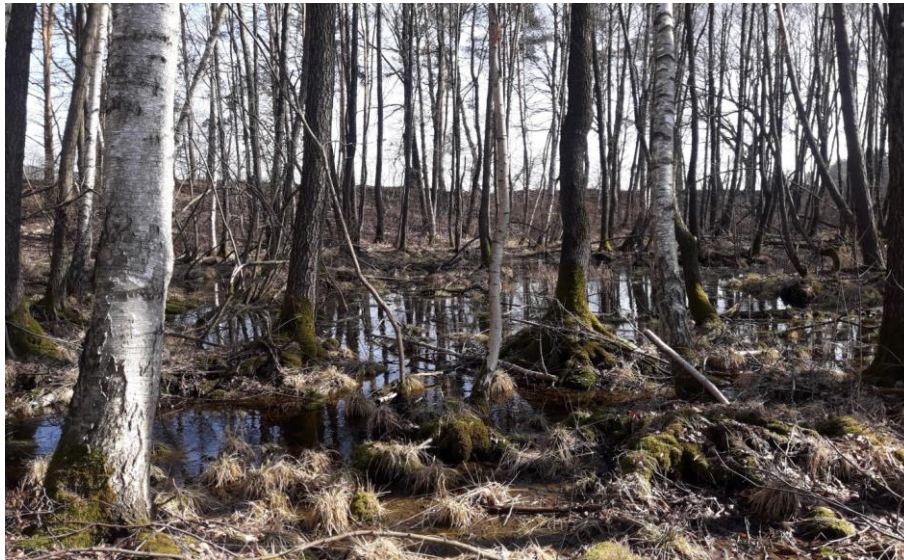
Abb. 14: Schwarzerlen-Sumpfwald mit Moorbirken, ohne funktionalen Zusammenhang zu einem Fließgewässer

der herrschenden Baumschicht vor. Diese Flächen sind schwierig zu bewirtschaften, Hauptnutzung war und ist Brennholz, das oft niederwaldartig im Stockausschlagswald gewonnen wurde. Naturschutzfachlich sind solche Wälder auf Nassstandorten von hoher Bedeutung. Hier bieten sich viele unterschiedliche Lebensräume für Insekten, die wiederum die Nahrungsgrundlage für Vögel stellen. Vor allem die späten Entwicklungsstadien mit größerem Biotopbaum- und Totholzangebot können über das Vertragsnaturschutzprogramm Wald gefördert werden. Entwässerung und Kahlhiebs sind zu vermeiden.