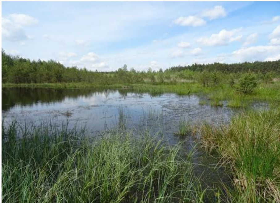
Abb. 4: Struktur- und vegetationsreiches Moorgewässer am Süden des Paulusweihers

Von den 24 Vorkommen mit knapp 92 ha Gesamtfläche im FFH-Gebiet liegen 22 in den einander benachbarten Naturschutzgebieten "Eschenbacher Weihergebiet" und "Vogelfreistätte Großer Rußweiher" nordwestlich von Eschenbach. Ein isoliertes Gewässer wurde westlich von Schwarzenbach erfasst und eines westlich von Mantel.