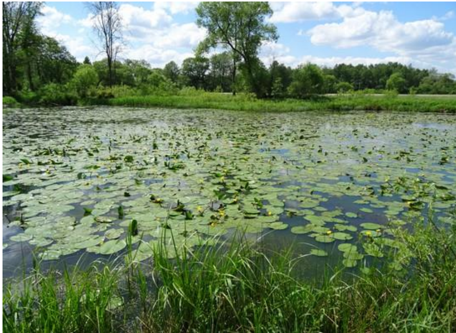
Abb. 3: Altwasser mit üppiger Teichrosendecke zwischen Mantel und Weiherhammer