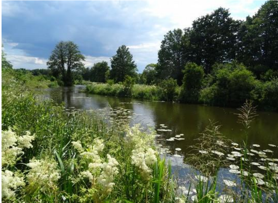
Abb. 1: Altarm der Haidenaab bei Mantel