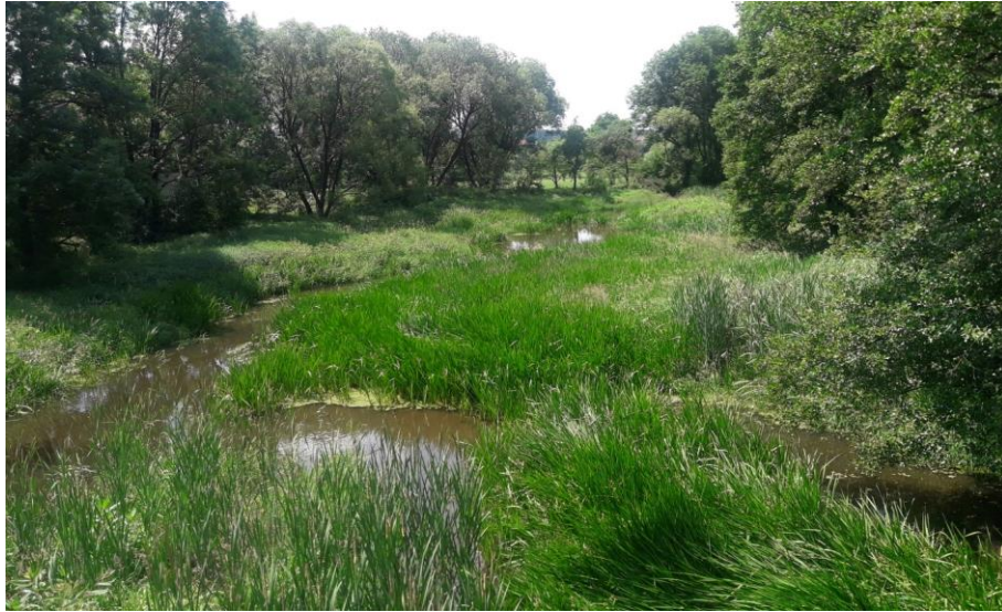
Abb. 8: Galerie-Auwald am Fließgewässer in enger Verzahnung mit Offenland

Die Bodenvegetation wird von Hochstauden (Mädesüß, Giersch) und Nässezeigern (Schwertlilie, Wald-Hainsimse), sowie Frühblüher (Scharbockskraut, Märzenbecher, Sumpfdotterblume), Gräsern (Rohrglanzgras, Sumpf-Reitgras) und Schilf gebildet. Als ostbayerische Besonderheit kommt in weniger durchströmten Bereichen die Schlangenzunge ( Calla palustris ) mit teilweise ausgedehnten Beständen vor.