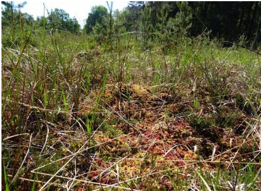
Abb. 7: Moorvegetation am Böllerweiher (u.a. Sphagnum magellanicum , Moosbeere und Wollgras)

Im Gebiet findet sich der Lebensraumtyp vornehmlich im Weihergebiet nordwestlich von Eschenbach. Zudem gibt es ein isoliertes Vorkommen bei der Kollermühle zwischen Bärnwinkel und Grafenwöhr und eines westlich von Mantel (letztere Fläche wurde bereits unter LRT 3160 erwähnt).