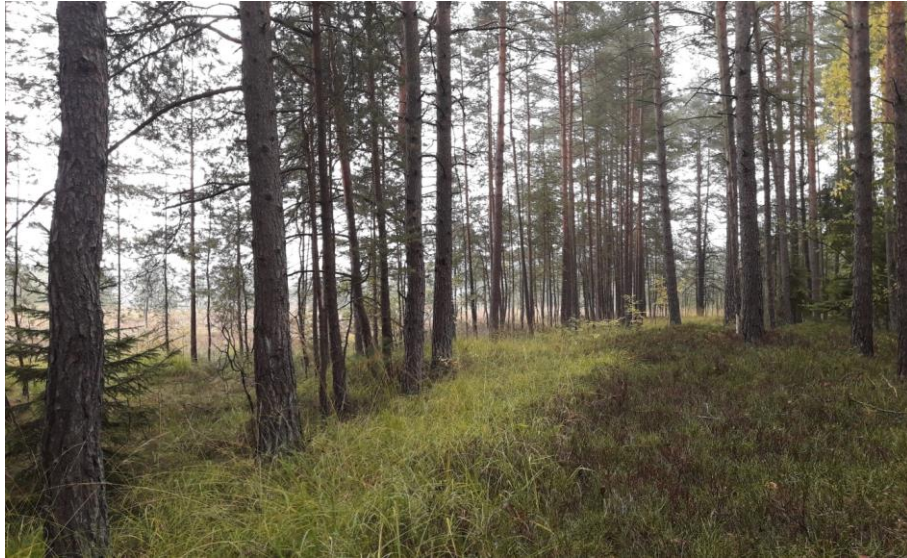
Abb. 12: Übergang vom Waldkiefern-Moorwald links zu trockenerem Kiefernwald rechts, abgegrenzt durch einen auffällig hellgrünen Pfeifengrasgürtel