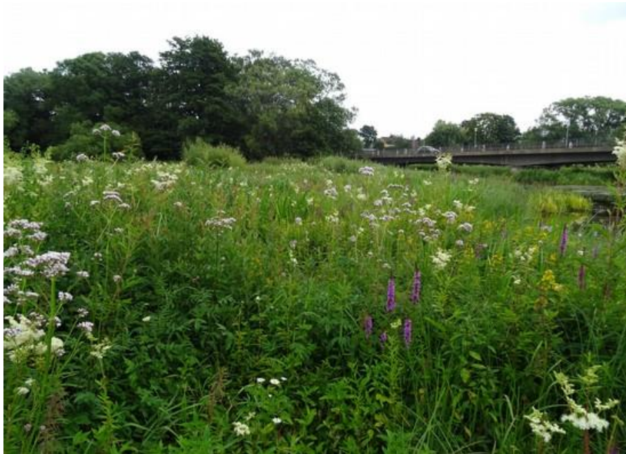
Abb. 5: Beispielhaft ausgebildete Hochstaudenflur an der Haidenaab bei Mantel

Im Gebiet wurden Hochstaudenfluren über die gesamte Länge der Haidenaabau verteilt gefunden, zudem an der Creußen bei Bärnwinkel und Bruckendorfgmünd sowie am Röthenbach südlich und südwestlich von Weiherhammer. Zusammen nehmen sie eine Fläche von gut 25 ha ein. Häufig liegen Komplexbildungen mit den nicht zu den FFH-Lebensraumtypen zählenden Biotoptypen Röhricht und Seggenried vor.