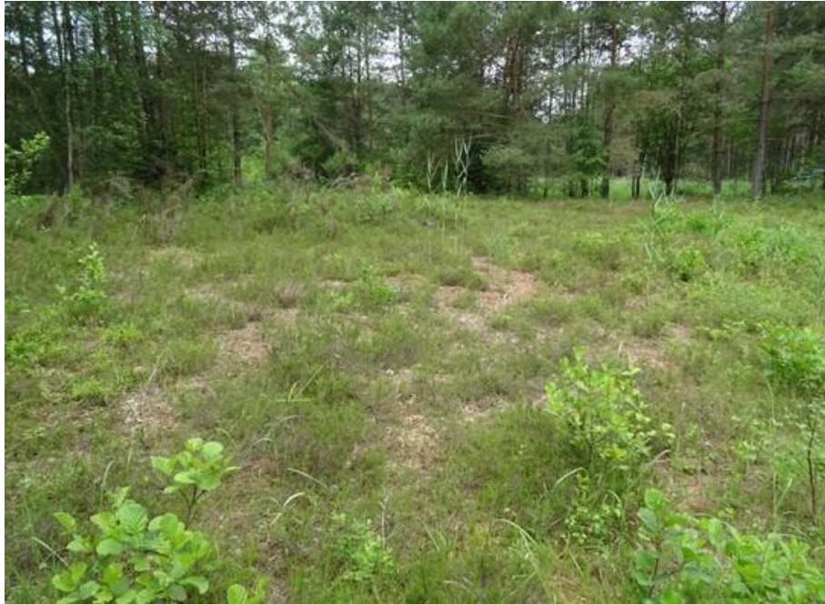
Abb. 11: Heidevegetation bei Bärwinkel