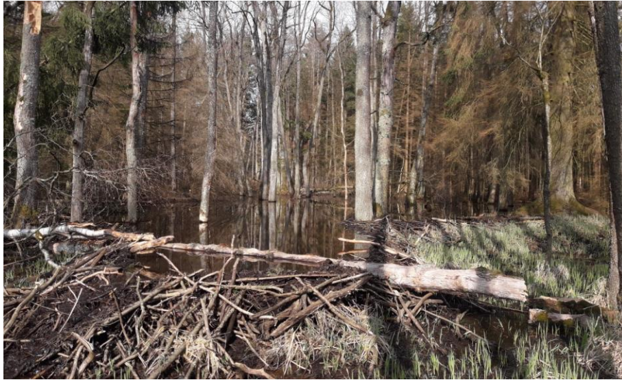
Abb. 13: Biberdamm auf der Grenze des FFH-Gebiets, Fichten und Schwarzerlen im Hintergrund durch Überschwemmungswirkung abgestorben