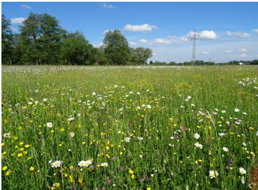
Abb. 6: Magere Flachland-Mähwiese zwischen Mantel und Weiherhammer