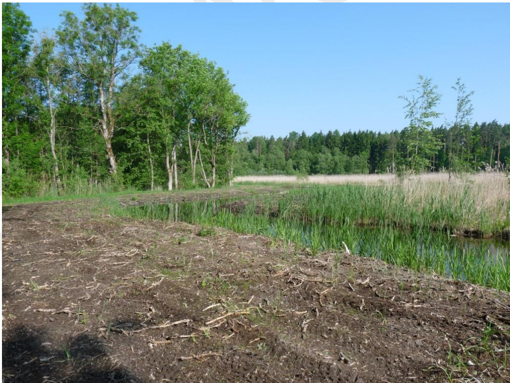
Abbildung 35: Artenschutzmaßnahme des LBV am Mittelweiher bei Heringnohe 2014

Diese Lebensräume sind für Blaukehlchen, Rohrdommel, Krickente, Teichrohrsänger, Wasserralle und Zwergtaucher sehr wichtig. Insbesondere bei Heringnohe kam es im Zuge von Artenschutzmaßnahmen für die Rohrdommel zu Verlusten von Verlandungsvegetation (Abb. 19 und 20).