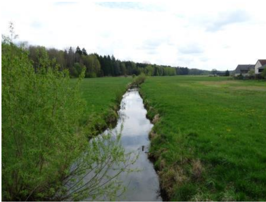
Abbildung 3: Schmalnohebach südlich Sorghof