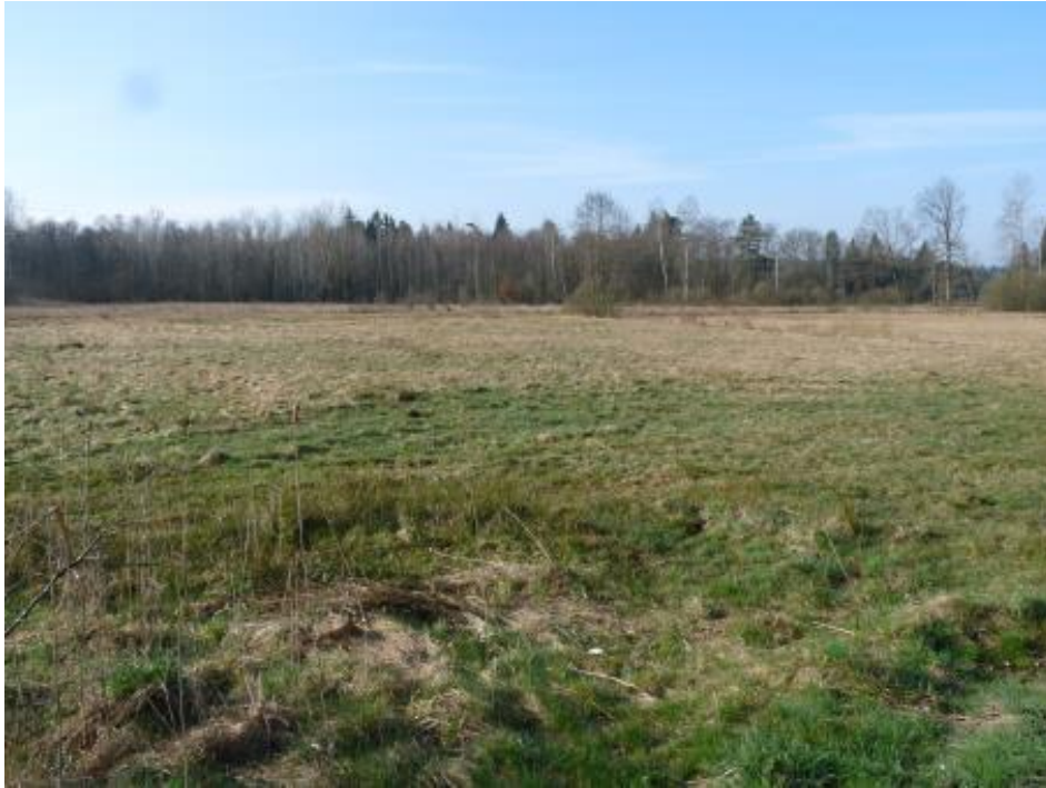
Abbildung 8: Feuchtwiese zwischen den Häuslweihern und dem Leinschlag