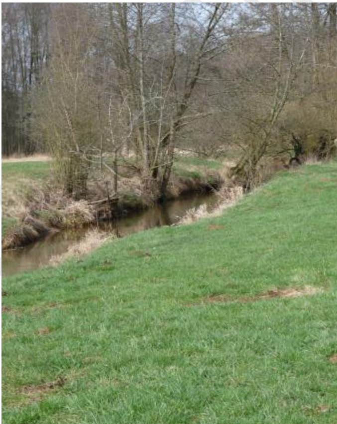
Abbildung 4: Vils im zentralen Bereich des SPA