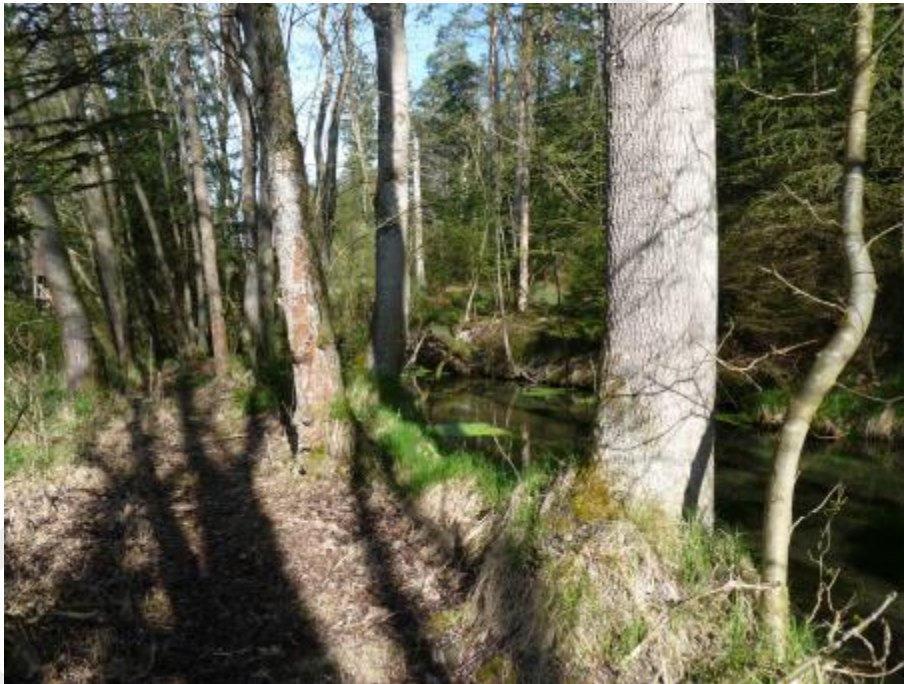
Abbildung 2: Auerbach bei Heringnohe

Das Europäische Vogelschutzgebiet (=SPA) „Vilsecker Mulde“ liegt zwischen den Teichen bei Heringnohe im Westen und Freihung im Osten im Oberpfälzer Hügelland. Es wird von den Fließgewässern Auerbach, Wiesennohe, Schmalnohebach und Frankennohe sowie der Vils durchzogen (Abb. 2, 3, 4).