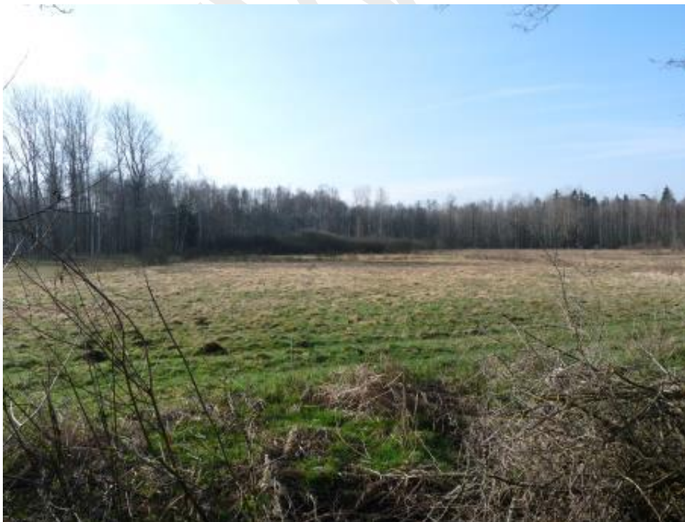
Abbildung 7: Nasswiese