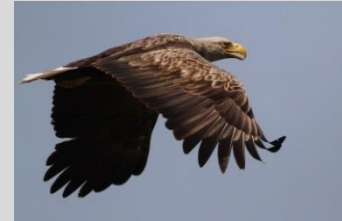
Abbildung 19: Seeadler

Mangel an großflächigen, intakten Feuchtgebieten mit störungsarmen Bruthabitaten.