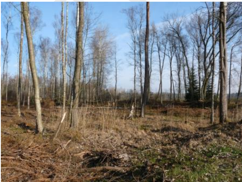
Abbildung 5: Sehr lichter Feuchtwald im zentralen Bereich der Vilsecker Mulde

Kennzeichnend für das SPA „Vilsecker Mulde“ sind die Laub- und Feuchtwälder in naturnaher Ausprägung mit einem hohen Totholz- und Höhlenbaumanteil (Abb. 5, 6). Ebenso hervorzuheben sind die z.T. extensiv, z.T. nicht genutzten Nass- und Feuchtwiesen mit Mooren und Sumpfteilen sowie die Übergänge von Feuchtwald zu den Offenlandbereichen (Abb. 7, 8). Auch die großen Gewässerflächen sind von hoher Bedeutung für viele Vogelarten (Abb. 9,10).