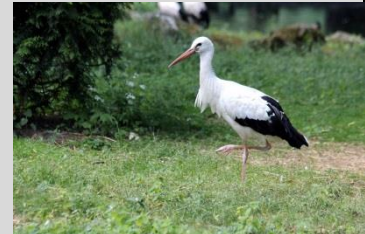
Abbildung 21: Weißstorch

Neben den günstigen Überwinterungsbedingungen (v.a. in Spanien) zeigt sich seit einigen Jahren eine zunehmende Tendenz verkürzter Zugstrecken bzw. ein Überwintern im näheren Umfeld der Brutplätze (teils durch Zufüttern). Dadurch werden die Risiken des Langstreckenzuges reduziert, was zu einer höheren Rückkehrrate führt und die bayerische Brutpopulation positiv beeinflusst.