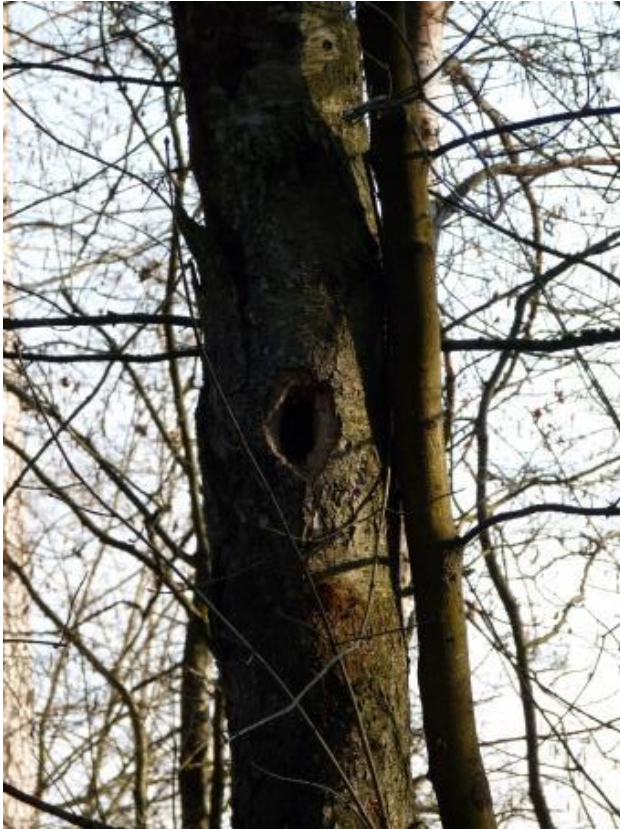
Abbildung 6: Höhlenbaum (Erle)