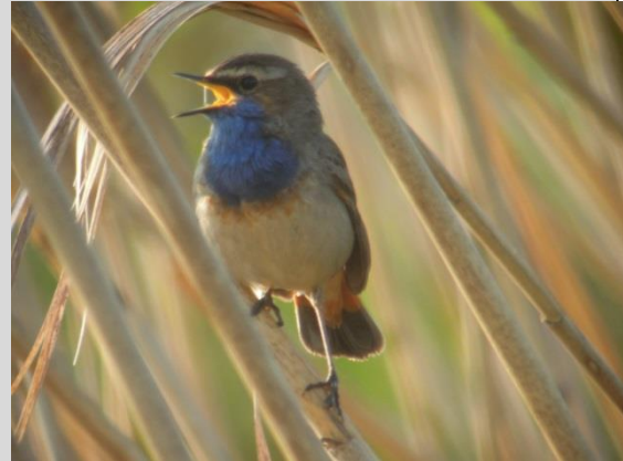
Abbildung 12: Blaukehlchen (Foto: J. Hofmann)

Das Blaukehlchen findet an Flussufern, Altwässern und Seen mit Verlandungszonen mit Schilf-, Rohrglanzglas-, Rohrkolben-, Weidenröschenbeständen geeigneten Lebensraum. Aber auch Erlen- oder Weiden-Weichholzauen, Nieder- und Übergangsmoore sowie Hochmoore mit Gagelbüschen werden besiedelt.