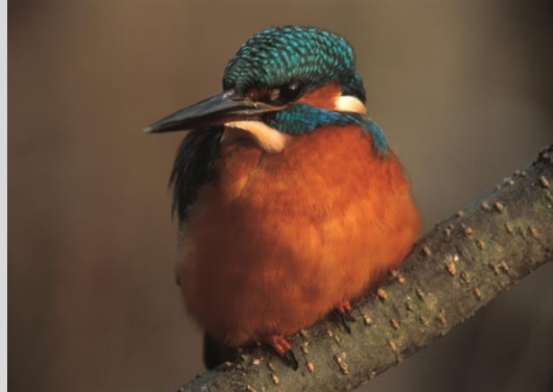
Abbildung 13: Eisvogel

Der Eisvogel besiedelt langsam fließende und stehende, klare Gewässer mit gutem Angebot an kleinen Fischen (Kleinfische, Jungfische größerer Arten) und Sitzwarten < 3 m im unmittelbaren Uferbereich. Auch rasch fließende Mittelgebirgsbäche sind besiedelt, wenn Kolke, Altwässer, strömungsberuhigte Nebenarme oder Teiche vorhanden sind.