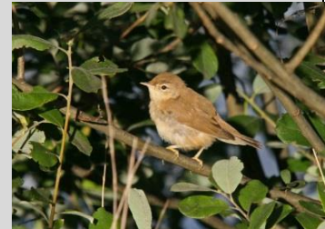
Abbildung 29: Teichrohrsänger

Der Teichrohrsänger besiedelt mindestens vorjährige Schilfröhrichte bzw. Schilf- Rohrkolbenbestände an Fluss- und Seeufern, Altwässern und Sümpfen. In der Kulturlandschaft findet man ihn auch an schilfgesäumten Teichen und Gräben aller Art. Die Art hat eine enge Bindung an Vertikalstrukturen. Buschwerk wird toleriert, sofern dieses nicht in zu lückigem Röhricht mit überwiegender Krautschicht steht. Auch sehr kleine Röhrichte bzw. schmale Röhrichtsäume (2 - 3 m) sowie Weidengebüsche mit Unterwuchs aus Rohrkolben und Großseggen (ohne Schilf) werden besiedelt. Selten ist die Art in geringer Dichte in Jungschilfbeständen anzutreffen.