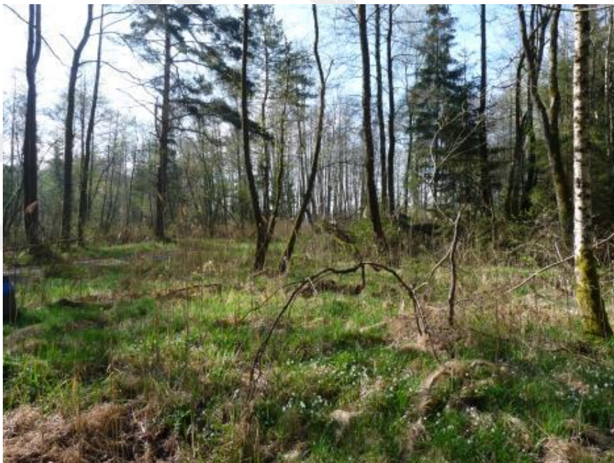
Abbildung 1: Feuchtwald bei Heringnohe

In den Feuchtwäldern der Vilsecker Mulde bei Heringnohe und im zentralen Bereich ist der Grauspecht charakteristisch. Ebenso werden diese Wälder mindestens zur Zugzeit vom Waldwasserläufer genutzt (Abb. 1).