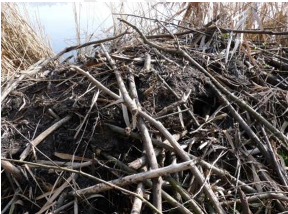
Abbildung 10: Biberburg am Häuslweiher

Der Biber ist in der Vilsecker Mulde sehr aktiv. Die Bereiche am Leinschlag wurden durch diese Art wieder stark vernässt und haben dadurch eine deutliche Aufwertung für die Vogelfauna erfahren.