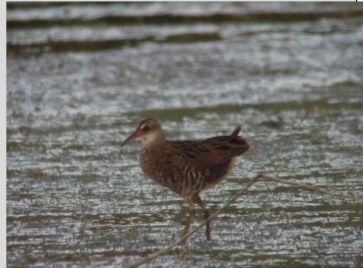
Abbildung 32: Wasserralle

Die Wasserralle besiedelt Verlandungszonen von Seen, Altwässern und Teichen. Sie brütet in Röhrichten, Seggenrieden sowie Rohrkolben im Bereich von Flachwasserzonen (Wassertiefe 5-20 cm), aber auch in Weiden- und Erlenbrüchen mit entsprechenden Wasserständen und dichtem Unterwuchs. Offene Wasserflächen sind keine Bedingung für eine Besiedlung.