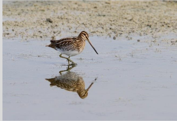
Abbildung 24: Bekassine

Die Bekassine brütet in Mooren und feuchten Grasländern, Überschwemmungsflächen und Verlandungszonen von Seen. Die Brutplätze sollen Übersicht bieten, dürfen aber auch locker mit Bäumen und Büschen bestanden sein. Wichtig sind eine ausreichende Deckung für das Gelege, aber eine nicht zu hohe Vegetation.