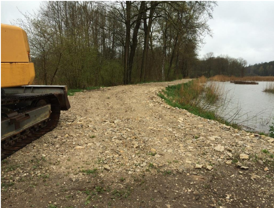
Abbildung 36: Artenschutzmaßnahme des LBV am Mittelweiher bei Heringnohe 2015

Der Bereich der Maßnahme für die Rohrdommel wurde im Winter 2015 leider durch Schotterung stark beeinträchtigt (Abb. 16).