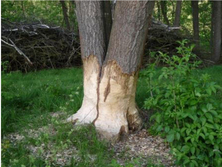
Abbildung 11: Typische Biberspuren in der Vilsecker Mulde