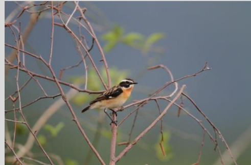
Abbildung 26: Braunkehlchen

Braunkehlchen sind Brutvögel des extensiv genutzten Grünlands, vor allem mäßig feuchter Wiesen und Weiden. Auch Randstreifen fließender und stehender Gewässer, Quellmulden, Streuwiesen, Niedermoore, nicht gemähte oder einmahlige Bergwiesen, Brachland mit hoher Bodenvegetation sowie sehr junge Fichtenanpflanzungen in hochgrasiger Vegetation werden besiedelt. Die Vielfalt reduziert sich auf bestimmte Strukturmerkmale, unter denen höhere Sitzwarten, wie Hochstauden, Zaunpfähle, einzelne Büsche, niedrige Bäume und sogar Leitungen als Singwarten, Jagdansitz oder Anflugstellen zum Nest eine wichtige Rolle spielen. Die bestandsbildende, tiefer liegende Vegetation muss ausreichend Nestdeckung bieten und mit einem reichen Insektenangebot die Ernährung gewährleisten.