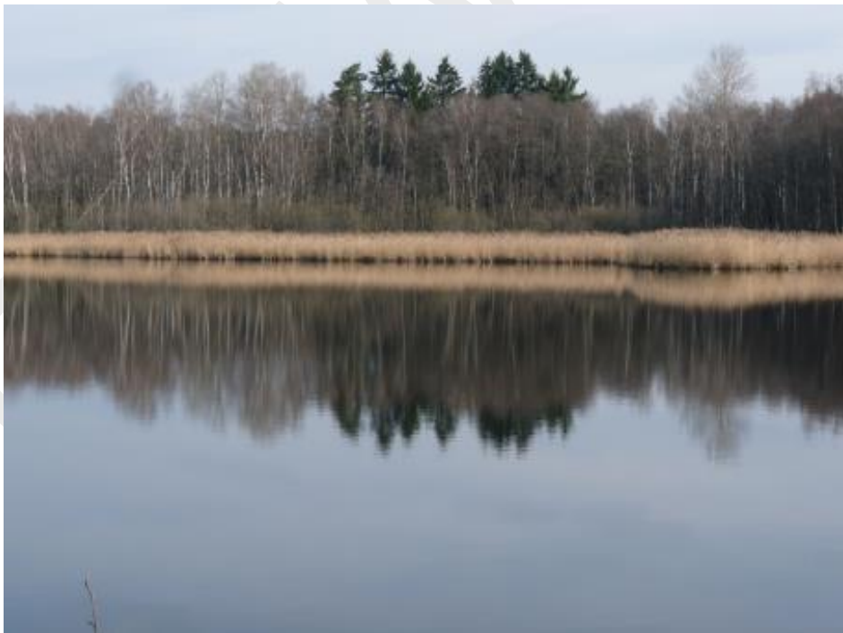
Abbildung 9: Großer Häuslweiher mit Verlandungsvegetation und Übergang in den Bruchwald