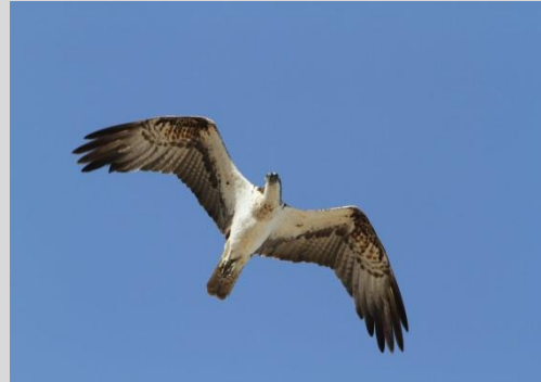
Abbildung 14: Fischadler

Der Fischadler bewohnt gewässerreiche Landschaften mit hohem Fischreichtum (die Sichttiefe der Gewässer ist dabei nicht entscheidend) und hochstämmigen Bäumen in Gewässernähe. Die Nahrung besteht so gut wie ausschließlich aus Fischen. Das Nest, nach mehrjähriger Benutzung oft eine gewaltige Burg aus Knüppeln und Zweigen, steht im Norden Europas auf hohen Bäumen, meist nicht weit vom Jagdgewässer entfernt. Im Süden Europas und Nordafrikas sind auch Fels- und Bodennester möglich. In Bayern nutzt der Fischadler Kunsthörste. Die Brutzeit reicht in Bayern von April bis Juni. Das Weibchen brütet, das Männchen wacht in Nestnähe und schafft Nahrung herbei. Die meisten Jungen europäischer Fischadler scheinen im ersten Jahr in Afrika zu bleiben oder ziehen nur bis ins Mittelmeergebiet.