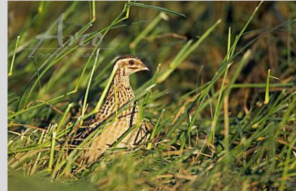
Abbildung 30: Wachtel

Die Wachtel brütet in der offenen Kulturlandschaft auf Flächen mit einer relativ hohen Krautschicht, die ausreichend Deckung bietet, aber auch mit Stellen schütterer Vegetation, die das Laufen erleichtert. Wichtige Habitatbestandteile sind Weg- und Ackerraine sowie unbefestigte Wege zur Aufnahme von Insektennahrung und Magensteinen. Besiedelt werden Acker- und Grünlandflächen, auch Feucht- und Nasswiesen, Niedermoore oder Brachflächen. Regional werden rufende Hähne überwiegend aus Getreidefeldern, seltener aus Kleefeldern gehört. Intensiv genutzte Wirtschaftswiesen spielen wegen ihrer Mehrschürigkeit kaum eine Rolle.