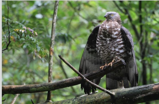
Abbildung 22: Wespenbussard

Bevorzugter Lebensraum des Wespenbussards sind alte, lichte, stark strukturierte Laubwälder mit offenen Lichtungen, Wiesen und sonnigen Schneisen (als Jagdhabitat) oder ein Landschaftsgemeinde aus extensiv bewirtschaftetem Offenland mit Feldgehölzen, Wiesen und alten Wäldern (auch Nadelwäldern).