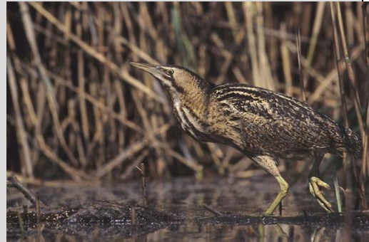
Abbildung 17: Rohrdommel

Gewässereutrophierung mit damit verbundenem Schilfsterven