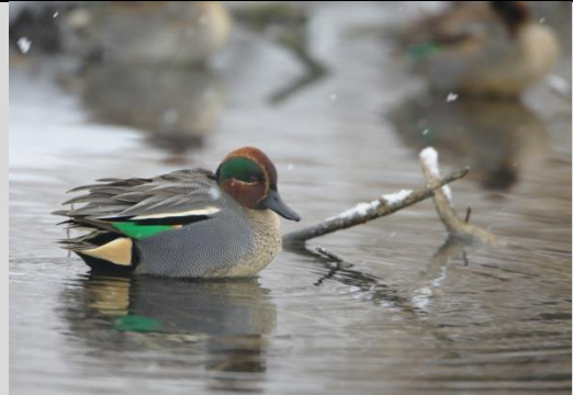
Abbildung 28: Krickente

Die Krickente benötigt als Lebensraum flache Binnengewässer mit vorwiegend dichter Ufer- und Verlandungsvegetation wie Röhrichte, Seggenriede oder Schwimmblattbestände. Sie ist an Altarmen in Flussauen, in Sümpfen, Mooren und Moorresten, Moorgräben, Torfstichen