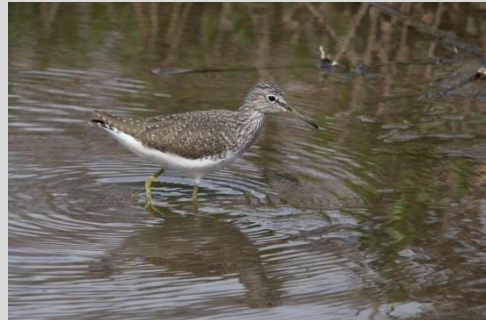
Abbildung 31: Waldwasserläufer

Der Waldwasserläufer besiedelt nasse Bruch- und Auenwälder, baumbestandene Hoch- und Übergangsmoore, Wald- bzw. Kleinstmoore, von Wald bestandene Uferpartien mit Still- und Fließgewässern sowie Erlenbruchwälder mit angrenzendem jungen Fichtenbestand. Die Brut- und Nahrungsreviere sind meist räumlich getrennt. Die Art brütet in Bäumen und nutzt vorzugsweise alte Drosselnester. Sie führt eine monogame Saisonehe mit einer Jahresbrut. Die Gelege bestehen aus (3)4 Eiern.