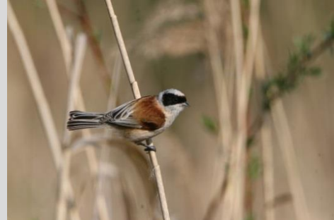
Abbildung 25: Beutelmeise

Die Beutelmeise besiedelt Verlandungszonen stehender und fließender Gewässer mit üppiger Vegetation, idealerweise mit einer Kombination aus Röhrichtbeständen und locker eingesprengten Büschen und Bäumen, die für die Anlage des frei hängenden Beutelnestes notwendig sind. Auch Gebiete ohne Röhricht werden besiedelt, meist jedoch erst spät in der Brutperiode, wenn hier geeignetes Nistmaterial zur Verfügung steht. Die Brutplätze befinden sich meistens in Gewässernähe und das Nest wird gerne direkt über das Wasser gebaut.