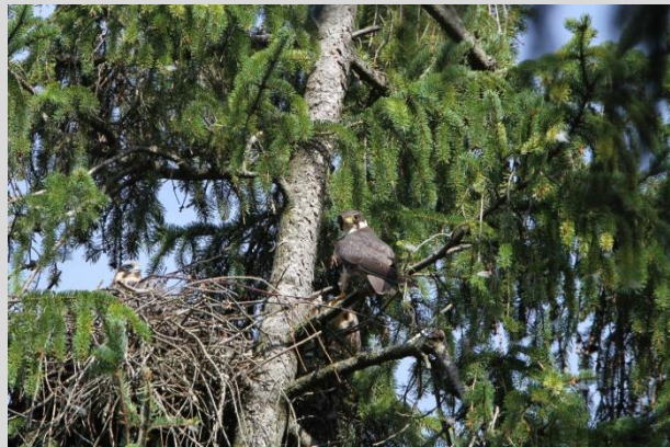
Abbildung 23: Baumfalke

Die Art bevorzugt halboffene bis offene (oft gewässereiche) Landschaften. Brutplätze sind zumeist in lichten, mindestens 80 - 100-jährigen Kiefernwäldern, und zwar häufig im Randbereich und an Lichtungen oder in Hangwäldern mit angrenzendem Offenland. Nistplätze finden sich jedoch auch in Feldgehölzen und Baumgruppen. Die Nahrungshabitate liegen z.T. in größerer Entfernung zum Brutplatz (bis zu 6,5 km nachgewiesen). Die