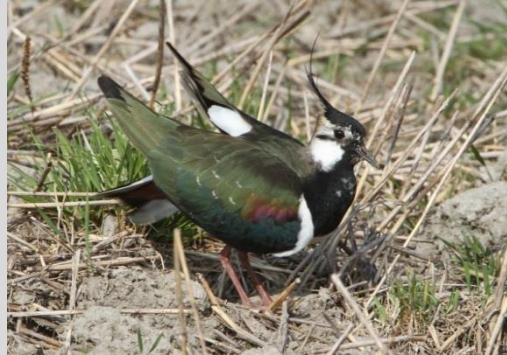
Abbildung 27: Kiebitz

Die Brutplätze liegen in offenen, zumeist flachen und baumarmen Landschaften. Am Nistplatz darf die Vegetationshöhe zum Brutbeginn nicht zu hoch sein, toleriert werden etwa 10 cm, bei sehr geringer Vegetationsdichte auch etwas mehr. Während der Kiebitz zu Beginn des 20. Jh. noch fast ausschließlich in Feuchtwiesen brütete, findet sich heute der Großteil der Gelege in Äckern. Wiesen werden bevorzugt dann besiedelt, wenn sie extensiv bewirtschaftet werden und noch Feuchtstellen aufweisen. Intensiv genutzte Silagewiesen sind dagegen als Brutplatz ungeeignet. Auch Brachflächen mit niedriger Vegetation, die durchaus auch relativ trocken sein dürfen, werden besiedelt. Kiebitze brüten zumeist in Kolonien und verteidigen nur die Umgebung des Nestes gegenüber Artgenossen. Im Extremfall lagen Nester nur 3 m voneinander entfernt.