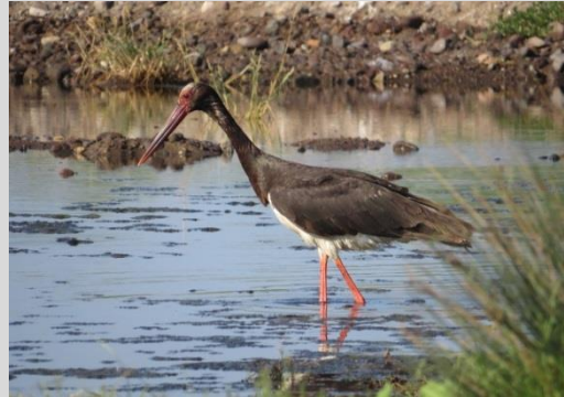
Abbildung 18: Schwarzstorch

Der Schwarzstorch ist ein Waldvogel, der als Brutraum große, geschlossene Waldgebiete bevorzugt. Für seinen Horst benötigt er alte Bäume mit lichter Krone bzw. starken Seitenästen, die das bis zu 300 kg schwere Nest tragen können. Nahrungsbiotop sind Waldbäche, Tümpel, Sümpfe und Feuchtwiesen (GLUTZ & BAUER 1987).