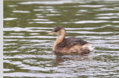
Abbildung 34: Zwergtaucher

Der Zwergtaucher brütet auf Stillgewässern aller Art, die einen Röhrichtsaum oder eine Verlandungszone, geringe Tiefe und in der Regel eine Mindestgröße von 0,1 ha aufweisen. Schmale Röhrichte von etwa 1 m Breite oder Röhricht-/Verlandungsflächen von wenigen Quadratmetern können als Neststandort ausreichen. Neben stehenden Gewässern werden auch Flüsse mit geringer Strömung besiedelt, ebenso Stauwurzeln von Flussstauungen. Selten brüten Zwergtaucher in Gewässern ohne Röhricht- oder Verlandungsvegetation mit Nestern in überhängendem Geäst von Weiden oder innerhalb von Wasserpflanzen. Regelmäßig besiedelt sind Fischteiche.