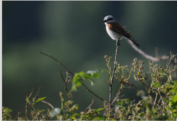
Abbildung 16: Neuntöter

Neuntöter besiedeln halboffene bis offene Landschaften mit lockerem, strukturreichem Gehölzbestand, v.a. extensiv genutzte Kulturlandschaft (Ackerfluren, Streuobstbestände, Feuchtwiesen und –weiden, Mager- und Trockenrasen), die durch Dornhecken und Gebüsche gegliedert ist. Die Bruthabitate liegen auch an Randbereichen von Fluss- und Bachauen, Mooren, Heiden, Dünentälern, an reich gegliederten Waldrändern, an von Hecken gesäumten Flurwegen und Bahndämmen. In Waldgebieten kommt die Art auf Kahlschlägen, Aufforstungs-, Windwurf- und Brandflächen vor. Industriebrachen, Abbaugelände wie Sand-, Kiesgruben und Steinbrüche sind ebenfalls besiedelt, wenn dort Dornsträucher (Brutplatz) und kurzrasige bzw. vegetationsarme Nahrungshabitate vorhanden sind.