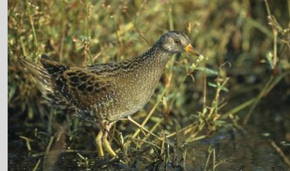
Abbildung 20: Tüpfelsumpfhuhn (Foto: M. Szczepanek*) https://commons.wikimedia.org/w/index.php?curid=59032

Das Tüpfelsumpfhuhn brütet in Bayern vor allem in Fischteichgebieten, an künstlichen und natürlichen Seen und Altwässern mit ausgedehnten Seggenzonen oder vergleichbaren feuchten bis nassen Grasgesellschaften und vereinzelt auch in Resten von Niedermooren und an Flüssen (z.B. Alz). Entscheidender abiotischer Faktor ist der Wasserstand. Die Wassertiefe sollte nicht höher als 30 cm sein. Schon geringfügige Änderungen des Wasserstandes führen zu Umzug oder vollständiger Aufgabe des Nistplatzes.