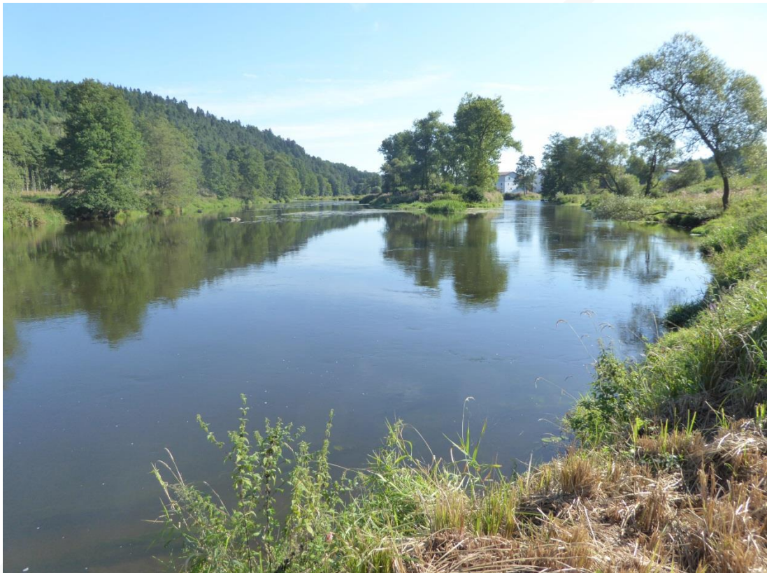
Abb. 1: Typische Landschaft am Regen (TG. 01)